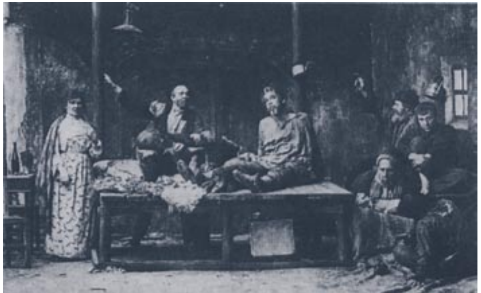
Stanislawski in seiner Inszenierung von Gorkis «Nachtasy»

Dazu muss nach Stanislawski der innere Bereich unserer Seele stets von neuem angeregt werden. Darstellende müssen deshalb auf der Bühne etwas erleben können. Er beschreibt in seinem System 14 Elemente, die echtes Erleben auf der Bühne ermöglichen. Die wichtigsten Elemente wollen wir hier aufzeichnen.